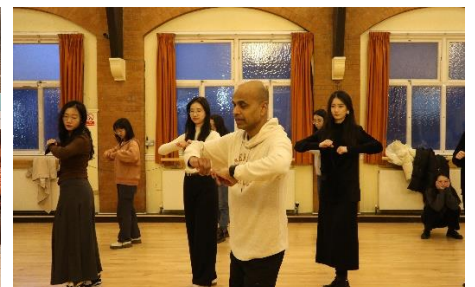
莎莎舞教学与联谊